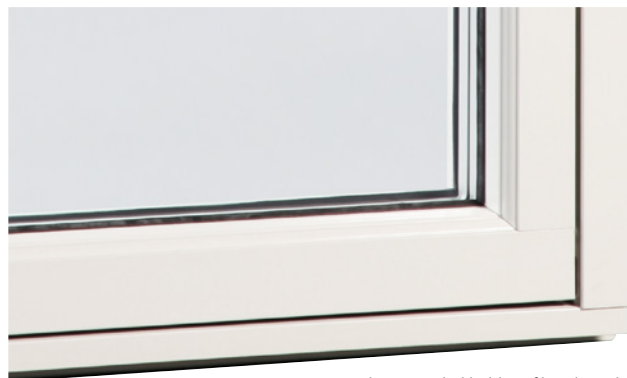
Aluminiumbeklädd profilerad utsida

Fönster med beslag som gör det möjligt att vrida runt fönsterbågen 180 grader så att fönstrets utsida hamnar inåt rummet. Fönstret levereras alltid med utfallsspärr som kräver två händer för att öppnas. Läs mer om våra produkter på outline.se