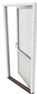
DFD med bröstning sett från insidan

Utåtgående 2-glas altandörr i olika utföranden. Nedan visas bilder sett från insidan.