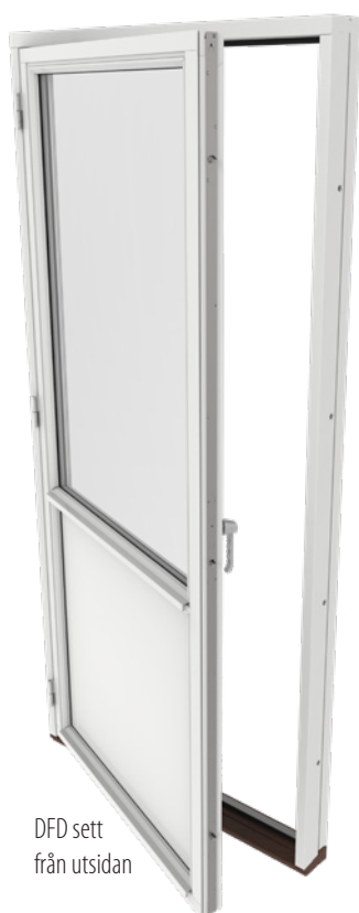
DFD sett från utsidan

Utåtgående 2-glas altandörr i olika utföranden. Nedan visas bilder sett från insidan.