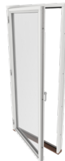
DFD helgas sett från utsidan